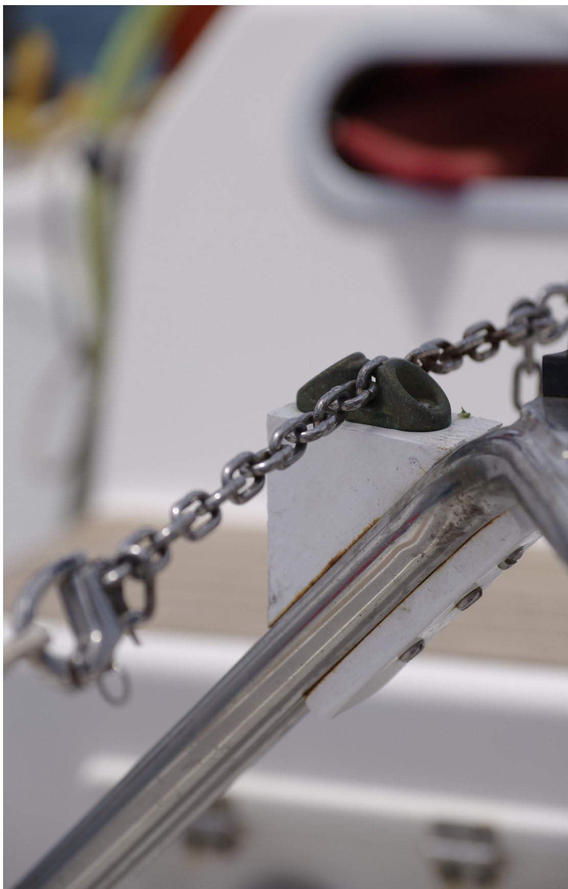
Pièce fixée à la barre franche. Partie blanche non fournie, fabriquée en contreplaqué.