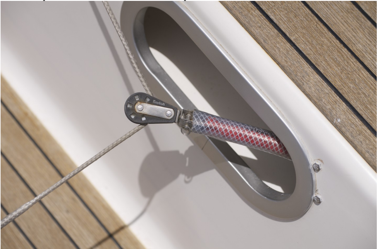
Deuxième poulie dans le cockpit.