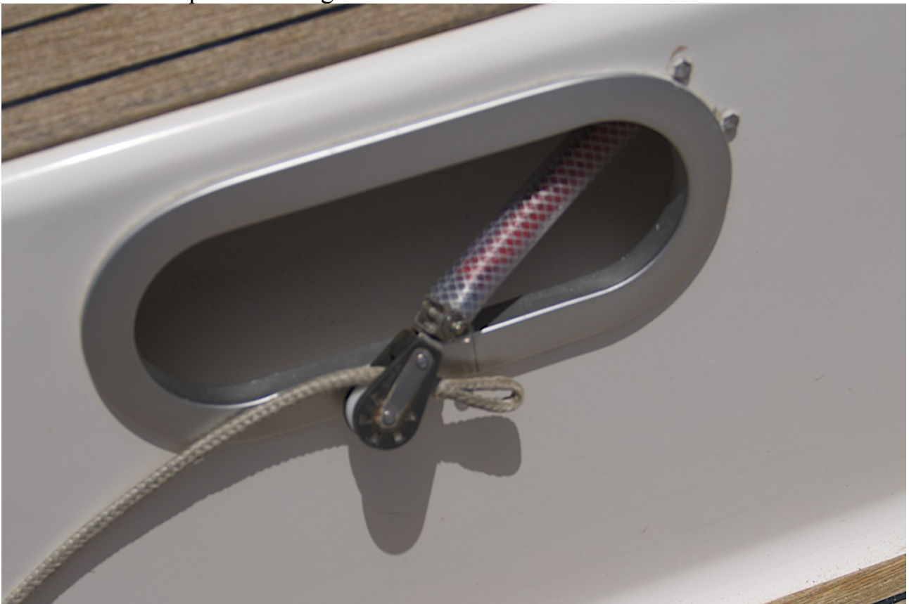
Démontage facile du bout.