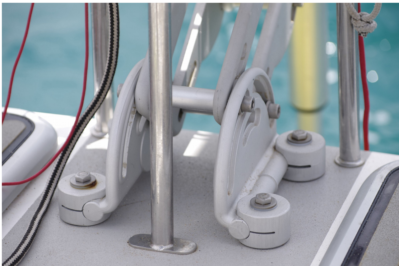
Fixation de l'ensemble.